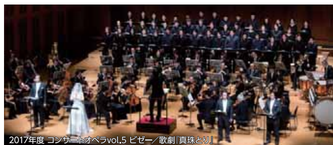
2017年度 コンサートオペラvol.5 ビゼー／歌劇『真珠と切』